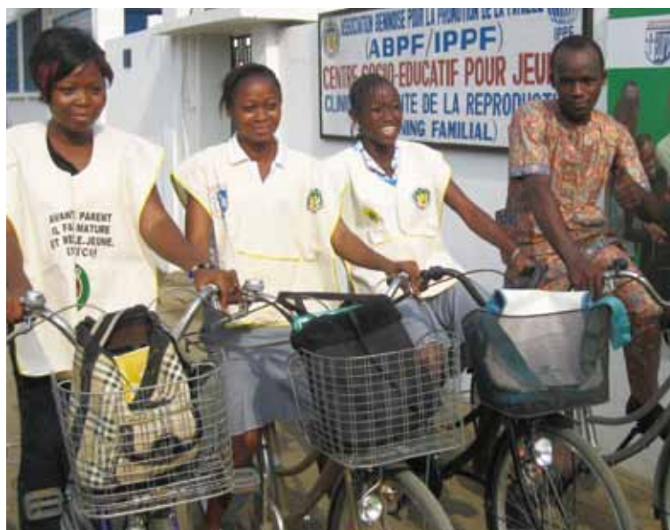
再生自転車を受け取ったベナンの コミュニティー・ヘルスワーカーたち

助産師は、自転車を利用して妊産婦を診療所に搬送したり、妊産婦の家庭を訪問して健康教育を行っています。