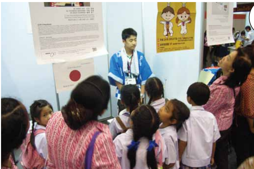
日本ブースでの国際交流風景

イのバンコクで開催された「2012世界青少年発明工夫展」に創作活動に励む日本の学生を派遣。展示会場では、出展作品の説明などを通して、他国からの参加者と交流を深めました。